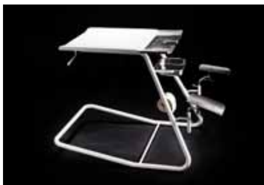
Inspiration till androstolen har hämtats ur intervjuer med vårdpersonal och patienter som berättat om sina egna upplevelser från undersökningar.

– Och generellt sett söker män vård betydligt mer sällan än kvinnor och betydligt senare. Det är ett