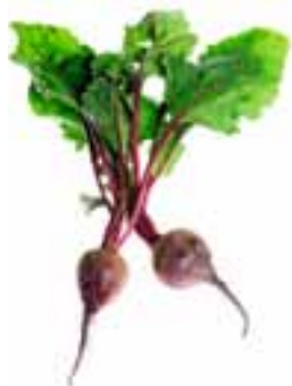
Ät rödbetor – och öka blodcirkulationen.

Den är inte bara röd, rund och vacker – utan också en riktig nyttobomb. Rödbetan innehåller mycket nitrat, som har ett klart samband med bättre kondition och viktning, skriver tidningen Må bra. Nitrat gör att kväveoxiden ökar i kroppen, vilket bland annat ger vidgade blodkärl, bättre blodcirkulation och på sikt sänkt blodtryck. Dessutom visar studier att en nitratrik kost också kan bidra till ökad muskelstyrka. TT Spektra