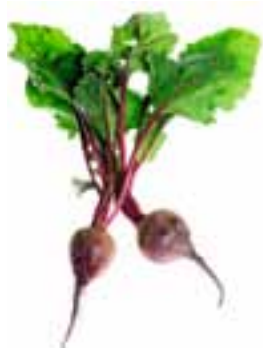
Ät rödbetor – och öka blodcirkulationen.

Den är inte bara röd, rund och vacker – utan också en riktig nyttobomb. Rödbetan innehåller mycket nitrat, som har ett klart samband med bättre kondition och viktning, skriver tidningen Må bra. Nitrat gör att kväveoxiden ökar i kroppen, vilket bland annat ger vidgade blodkärl, bättre blodcirkulation och på sikt sänkt blodtryck. Dessutom visar studier att en nitratrik kost också kan bidra till ökad muskelstyrka. TT Spektra